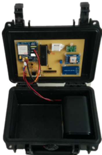
Das WaO Hardwaremodul für die Geo Positionierung und Sensorik. Das Modul wird innerhalb des Packstücks positioniert.